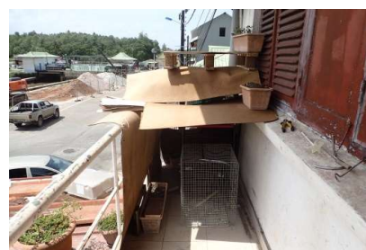
Le faucon détenu sur un balcon

Un rappel à la loi a été notifié par les inspecteurs de l'environnement du service, aux individus qui ont réalisé la mise en vente. Le principal mis en cause, quant à lui, a été convoqué devant un délégué du Procureur dans le cadre de l'ordonnance pénale et a été condamné à 1000 euros d'amende dont 400 euros avec sursis pour la détention (au titre des espèces protégées et de la faune sauvage captive) et le commerce (achat, mise en vente, cession irrégulière et utilisation d'une espèce protégée et reprise à la convention de Washington) du Faucon pèlerin.