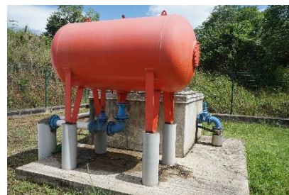
Forage Gotali à Mana

En juin 2023, des visites d'opérations ayant bénéficié du soutien financier de l'OFB ont été réalisées conjointement avec la CCOG, l'Office de l'Eau et la DGTM sur les communes d'Apatou, de Saint-Laurent du Maroni, de Mana, d'Iracoubo et de Sinnamary. Ces visites ont permis d'échanger avec les communes sur l'avancée des opérations financées, sur les problématiques rencontrées en matière d'assainissement et d'alimentation en eau potable, ainsi que sur les besoins et les futures opérations prévues.