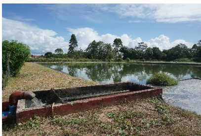
Lagune de Mana

Dans le cadre de la mise en œuvre de la solidarité interbassins (c'est-à-dire entre les bassins hydrographiques français), l'OFB soutient financièrement des études et des travaux en matière d'assainissement, de protection de la ressource, et d'alimentation en eau potable, au sein des territoires ultra-marins.